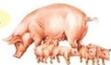
macióra i prosięta