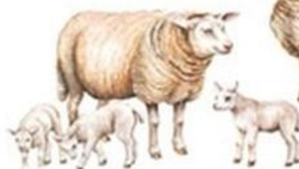
owca i jagnięta