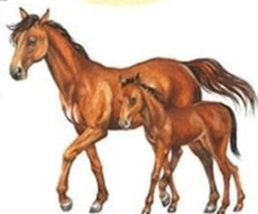
klacz i źrebię