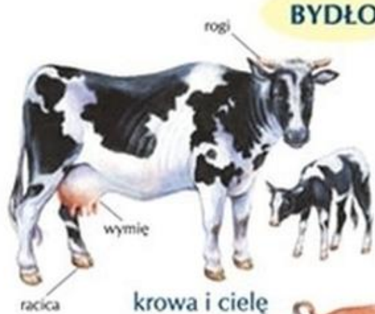
krowa i cielę