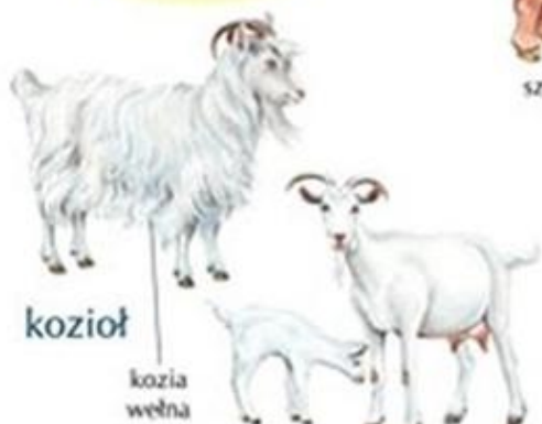
koza i koźlę